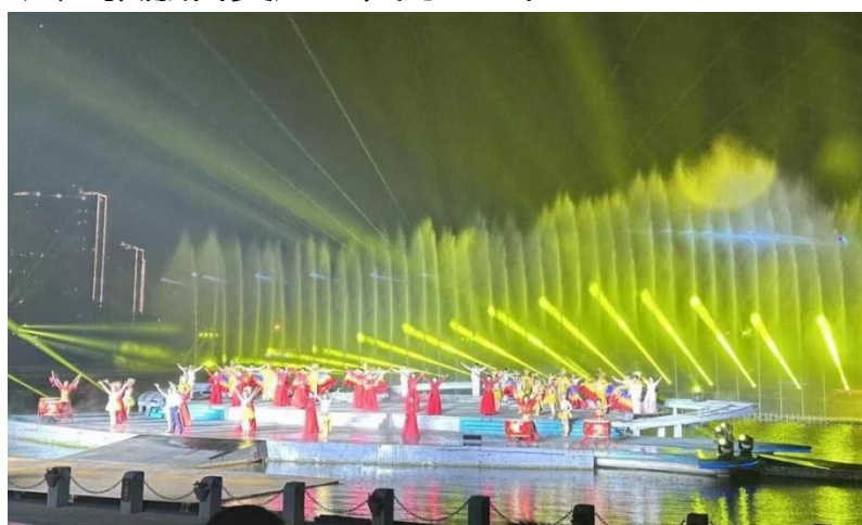
图 14：梦回庐陵五一演出现场

此次演出，对加快我市经济转型升级、推动旅游产业高质量发展必将产生巨大的推动作用；该校师生积极投身其中，不仅进一步积累了实践经验，展示了学校师生的良好风貌和风采，同时，也进一步密切了学校与省、市艺术相关企事业单位的联系，为进一步深化校企合作、产教融合奠定了良好基础。