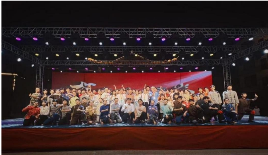
图 12：吉安市旅游产业高质量发展大会（遂川）演艺活动