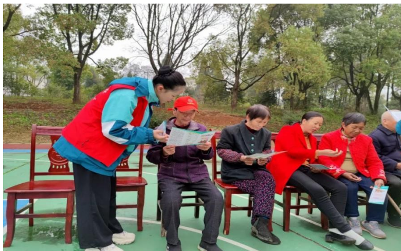
图 15：“强国复兴有我”学雷锋志愿服务活动

传承雷锋精神，最好的学习是行动，积极投身志愿服务的艺校学子会深刻把握新时代学雷锋志愿服务“坚守崇高理想、秉持人民情怀、践行奉献精神、投身民族复兴”的思想内涵和实践要求，用担当奉献诠释新时代雷锋精神，下一步，吉安文艺学校团委将继续动员全校广大团员青年积极参与“学雷锋”志愿服务活动，以实际行动书写新时代雷锋故事，让雷锋精神薪火相传、常在常新。