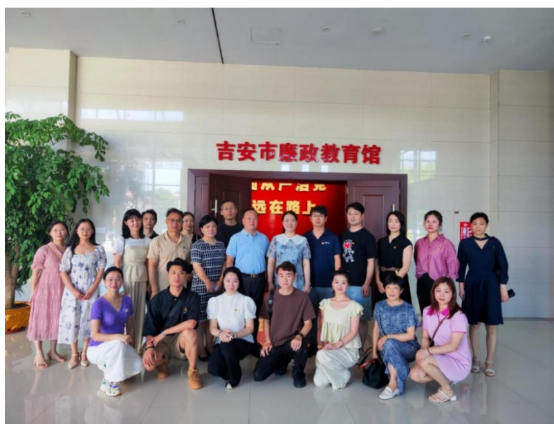
图 1：开展党建主题教育活动