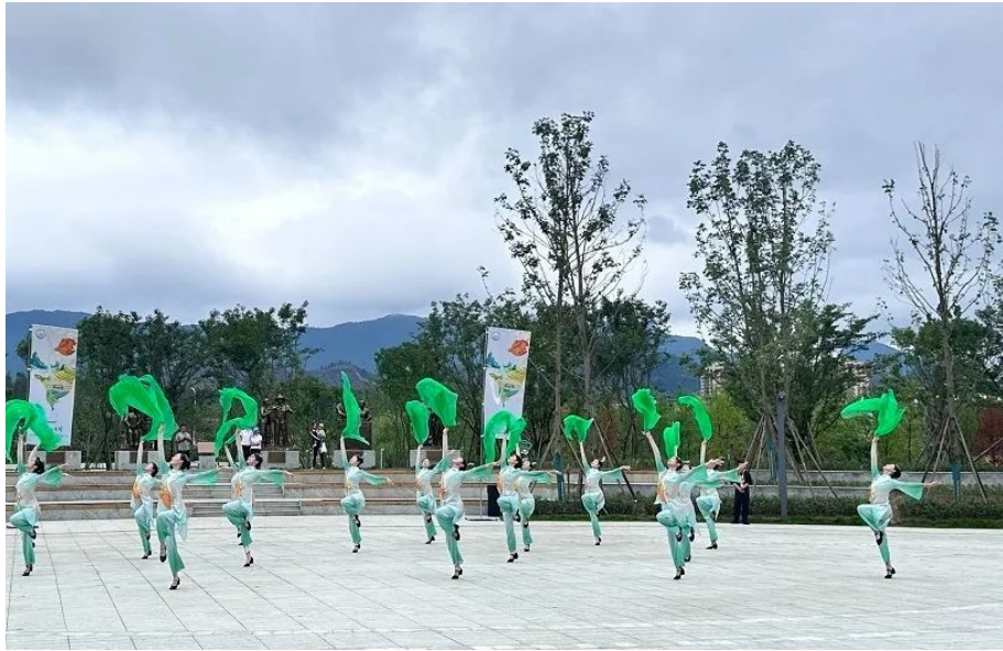
图 9：茶香公园演出现场

此次演出，学校负责红色文化街区、狗牯脑茶香园、汤湖神茶谷、天空之境、桃源梯田、度心剧场等景区点的演艺活动。其中，红色文化街区演出讲述了 1927 年革命时期先烈们用鲜血和生命保护“六条枪”、两位母亲为国捐躯、“工农兵政府”红色印章的故事，呈现了穷苦农民翻身掌大印的烽火岁月，讴歌了革命先烈为建立新中国而英勇奋斗的精神，激励人们弘扬跨越时空的井冈山精神。