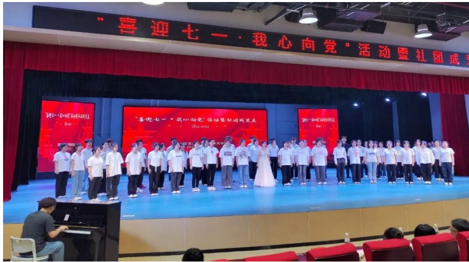
图 5：“喜迎七一、我心向党”活动暨社团成果展