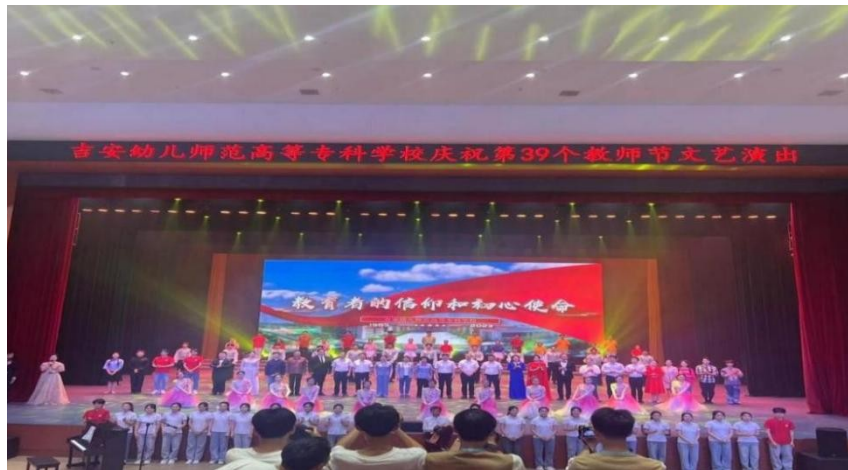
图 13：第 39 个教师节文艺演出舞蹈《一个都不能少》群舞情景表演《新的天地》