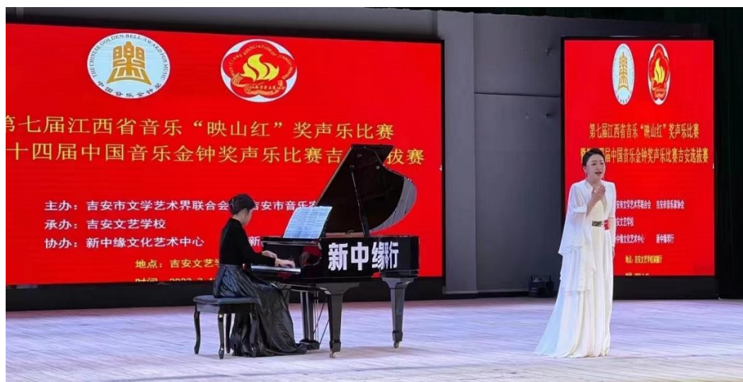
图 7：第七届江西省音乐“映山红”奖声乐比赛暨第十四届中国音乐金钟奖声乐比赛吉安选拔赛