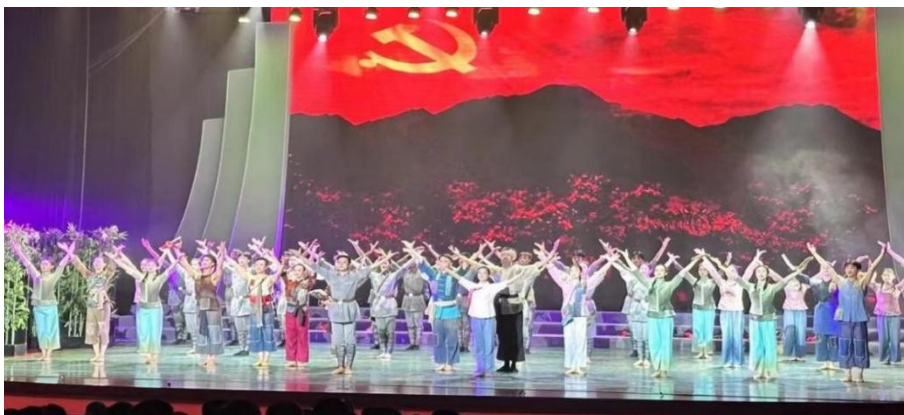
图 11：职业院校红色文化育人共同体成立大会演出活动舞剧《井冈井冈》

在红色文化育人共同体成立大会的成功演出，不仅彰显了学校红色文化育人的实践能力和创作能力，更是学校充分发挥专业优势，传承红色基因、赓续红色血脉，实现“三全育人”的生动实践。