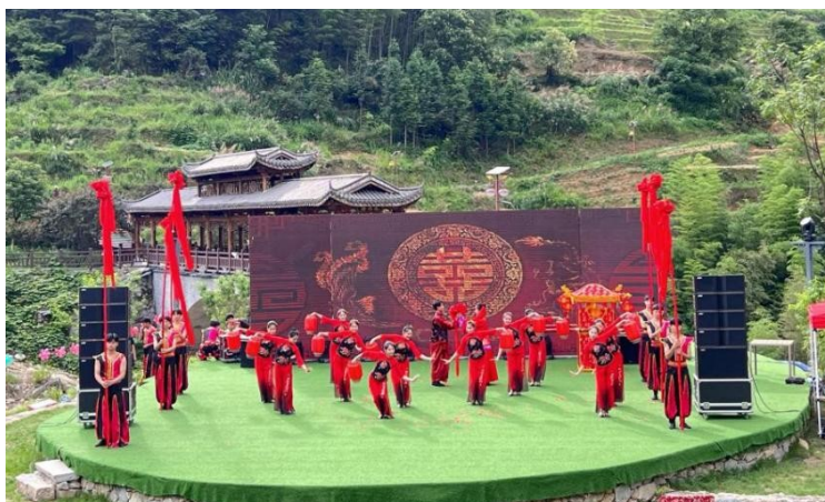
图 2：参演 2023 年吉安市旅游产业高质量发展大会